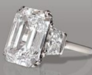
BAGUE DIAMANT SIGNÉE GRAFF 13,01 cts couleur D