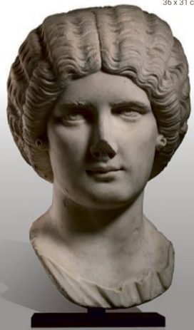
PORTRAIT D'UNE JEUNE FEMME Art Romain, Période Antonine, I er siècle Marbre, H. 33 cm

3 EXPERT CABINET BEAUVOIS 85 Bd Malesherbes - Paris 8 e 00 33 (0)1 53 04 90 74 arnaud@beauvois.info