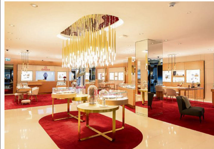
Boutique Omega: vue du rez-de-chaussée.

Pour autant, la boutique ne se limite pas aux garde-temps. Elle propose aussi des bijoux de la marque, de la maroquinerie, des lunettes de soleil et le parfum pour homme Omega Aqua Terra. Sylvie Guerreiro