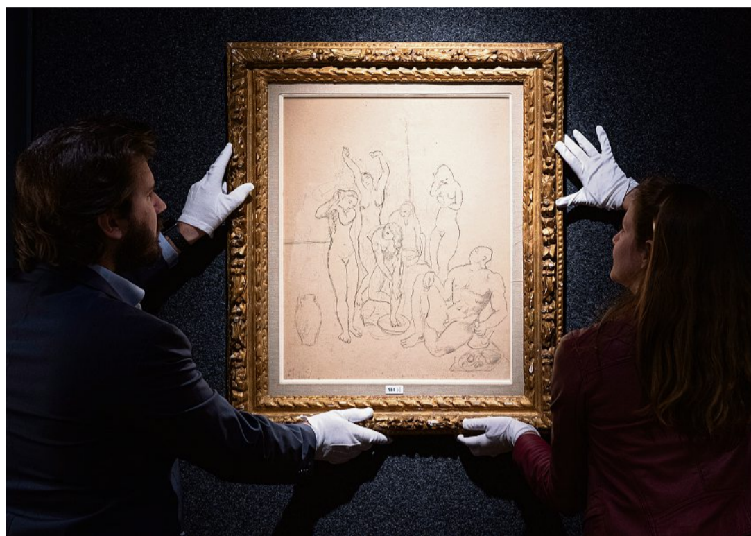
Esquisse pour Le Harem, Picasso, 1906, crayon sur papier. PIGUËT- HÔTEL DES VENTES/DR