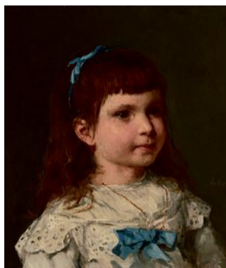
ALBERT ANKER (1831-1910) Portrait de fillette 36 x 31 cm