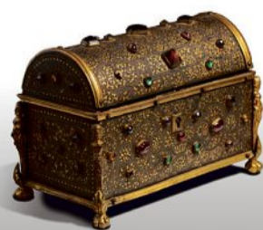
COFFRET XVII e SIÈCLE En fer damasquiné et bronze doré Pierre semi-précieuses 11,5 x 16,5 cm